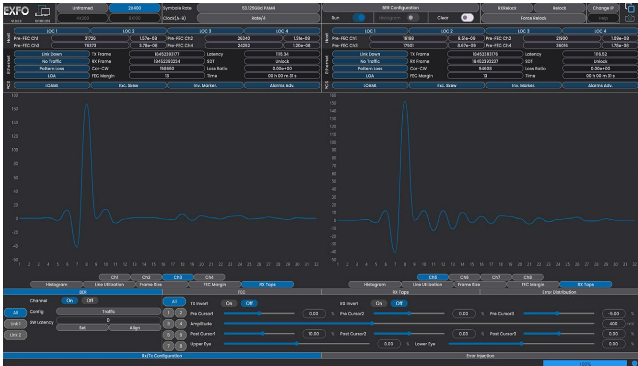
图3.检测ISI和远端反射。

BA-4000-L2支持多达32抽头的前馈均衡器（FFE）。它检测码间干扰（ISI）和远端反射。