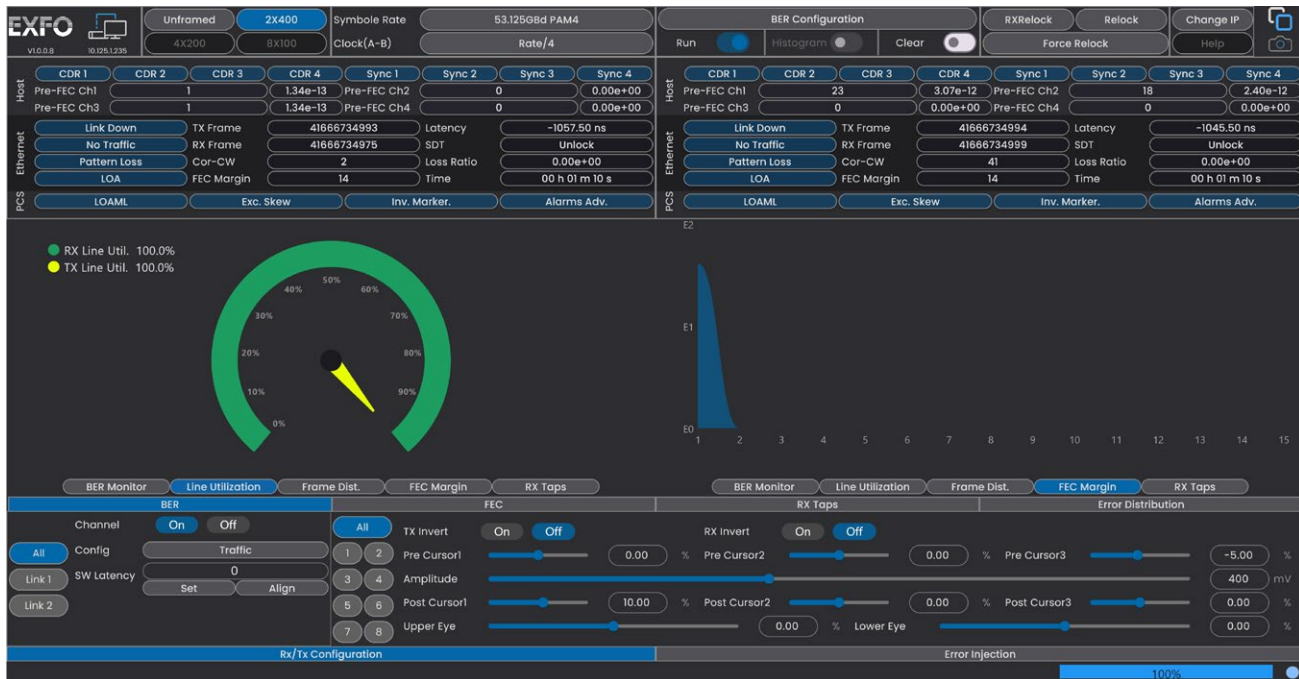
图4.测试前后的FEC误码率、符号误差分布和FEC余量。

监控关键参数，例如Rx/Tx帧计数和线路利用率。实时FEC分析提供前/后FEC BER、符号错误分布和FEC余量的测试。