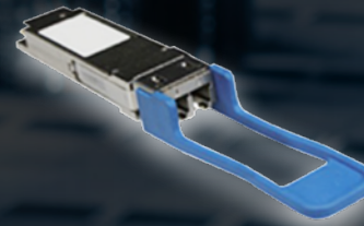
製造における 品質管理