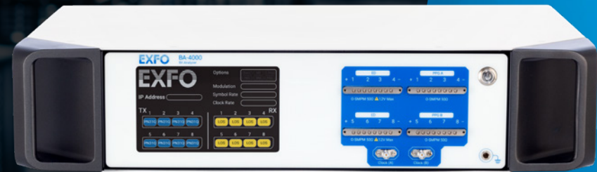
BA-4000 800G ビットエラーレート (BER) テスタ