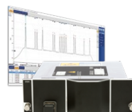
光谱分析仪 FTBx-5245/5255/ 5243-HWA