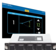
光开关 FTBx-9110/ FTBx-9160